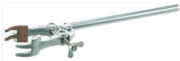
Rys 2. łącznik dwustronny prostokątny z żeliwa chromowanego