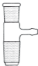
Rys. 4. Lejek laboratoryjny ze szkła borokrzemowego typ 3.3, zwykły kąt 60°, krótka nóżka. (D1/D2/L)